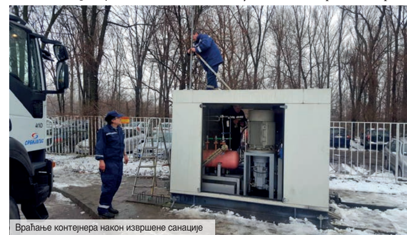
Враћање контејнера након извршене санације

Рецимо овде и то да су на овом послу, поред већ поменутих, радиле и колеге из Радне јединице „Мерење и регулација-АГТ“ Нови Сад, Одељења возног парка, РЈ „Транспорт“ Нови Сад и Службе Безбедности и здравља на раду и заштите од пожара.