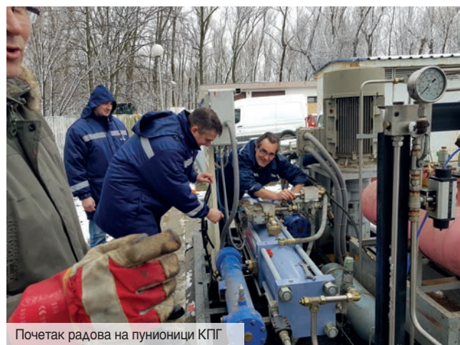
Почетак радова на пунилици КПП