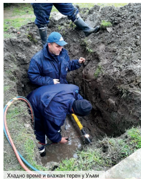
Хладно време и влажан терен у Уљми

Према информацији коју смо добили у Радној јединици „Дистрибуција гаса“ Панчево,