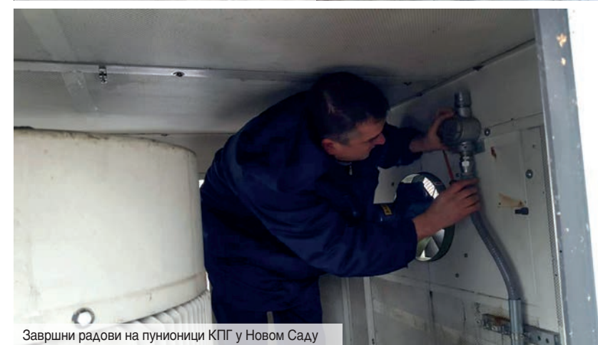
Завршни радови на пунилици КПП у Новом Саду