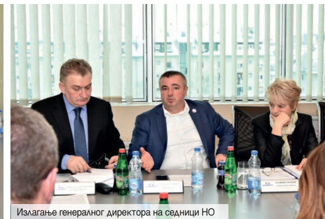
Излагање генералног директора на седници НО

Надзорни одбор Јавног предузећа „Србијагас“ на седници одржаној 27. фебруара у Новом Саду усвојио је Редовне финансијске извештаје предузећа за период јануар-децембар 2017. године, као и Извештаје о реализацији годишњег програма пословања од 01.01-31.12.2017. године.