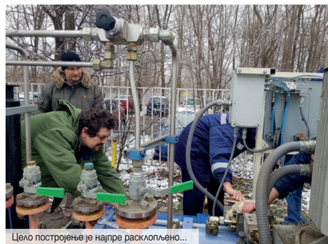
Цело постројење је најпре расклопљено...

- Покушаћу да појасним какав изазов смо имали пред собом. Најпре је било потребно