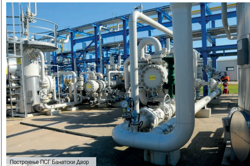
Постројење ПСГ Банатски Двор