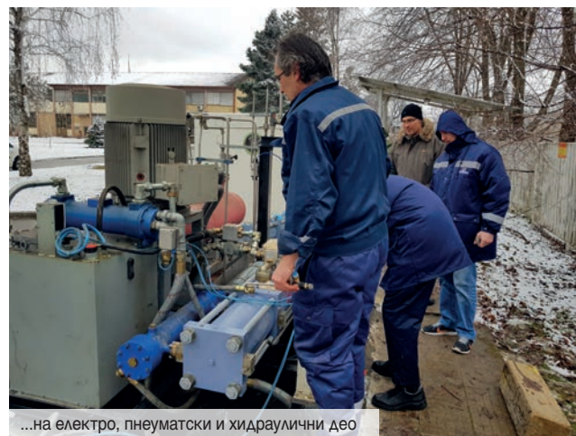
...на електро, пнеуматски и хидраулични део

расклопити цело постројење, а то значи расклапање електро, пнеуматског и хидрауличног дела по тачном редоследу, да бисмо га накнадно успешно саставили и повезали, а затим и извући комплетну количину хидрауличног уља и расхладне течности. Морам овде да напоменем да је ово посао који до сада никада нисмо радили и који у иностранству обично врши произвођач пунилишта. Сам цилиндар, који представља срце целог тог система тежак је око 800 килограма, што захтева ангажовање камиона са дизалицом, па смо због тога ангажовали колеге из Радне јединице „Одржавање гасовода“ Зрењанин. Подизање контејнера, вађење старог цилиндра и постављање новог прошло је без већих проблема, упркос снегу и хладном времену. Након тога приступило се