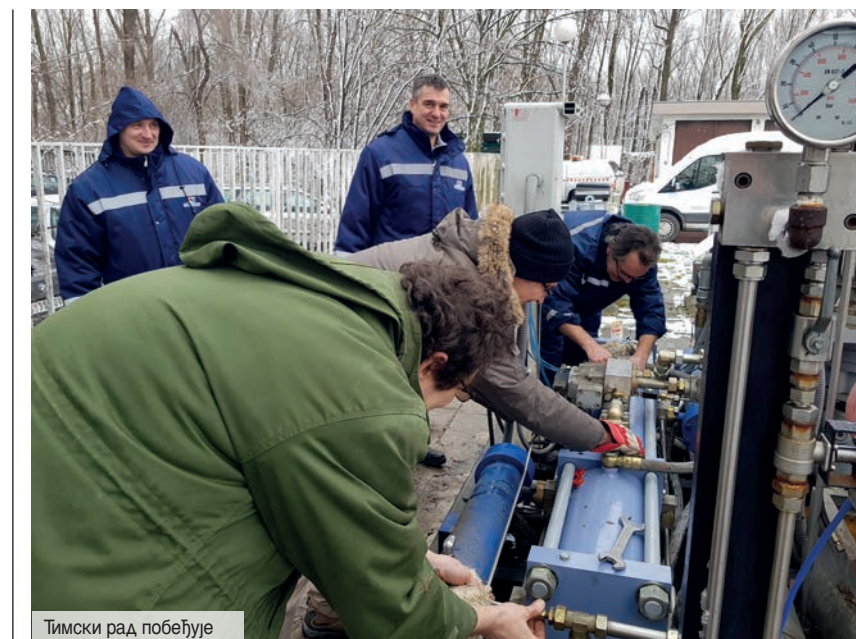
Тимски рад побеђује

расклопити цело постројење, а то значи расклапање електро, пнеуматског и хидрауличног дела по тачном редоследу, да бисмо га накнадно успешно саставили и повезали, а затим и извући комплетну количину хидрауличног уља и расхладне течности. Морам овде да напоменем да је ово посао који до сада никада нисмо радили и који у иностранству обично врши произвођач пунилишта. Сам цилиндар, који представља срце целог тог система тежак је око 800 килограма, што захтева ангажовање камиона са дизалицом, па смо због тога ангажовали колеге из Радне јединице „Одржавање гасовода“ Зрењанин. Подизање контејнера, вађење старог цилиндра и постављање новог прошло је без већих проблема, упркос снегу и хладном времену. Након тога приступило се