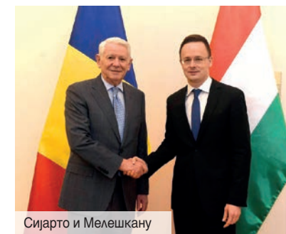
Сијарто и Мелешкану

Румунија ће испунити техничке услове за извоз гаса у Мађарску од 2020. године, прецизирано је споразумом који су 5. фебруара потписали министри иностраних послова две земље, Петер Сијарто и Теодор Мелешкану , извештава мађарска новинска агенција МТИ.