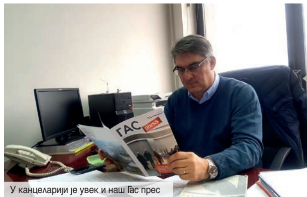
У канцеларији је увек и наш Гас прес

- На овај начин, обезбедиће се довољне количине гаса за домаћинства и индустријске потрошаче у делу Крагујевца, од места Петровац до Собовице, закључује наш саговорник.