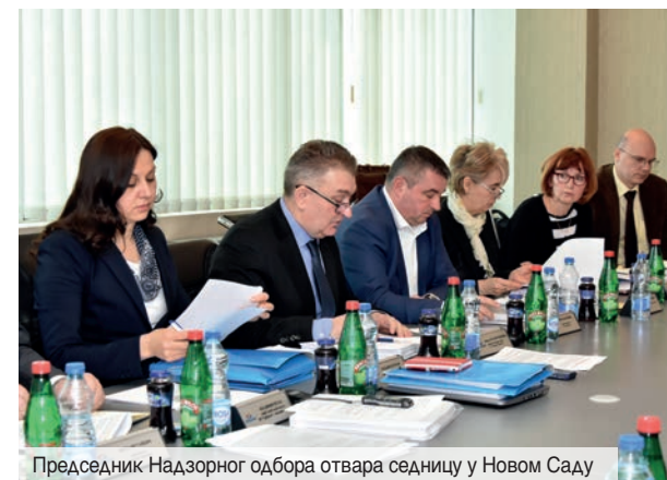
Председник Надзорног одбора отвара седницу у Новом Саду