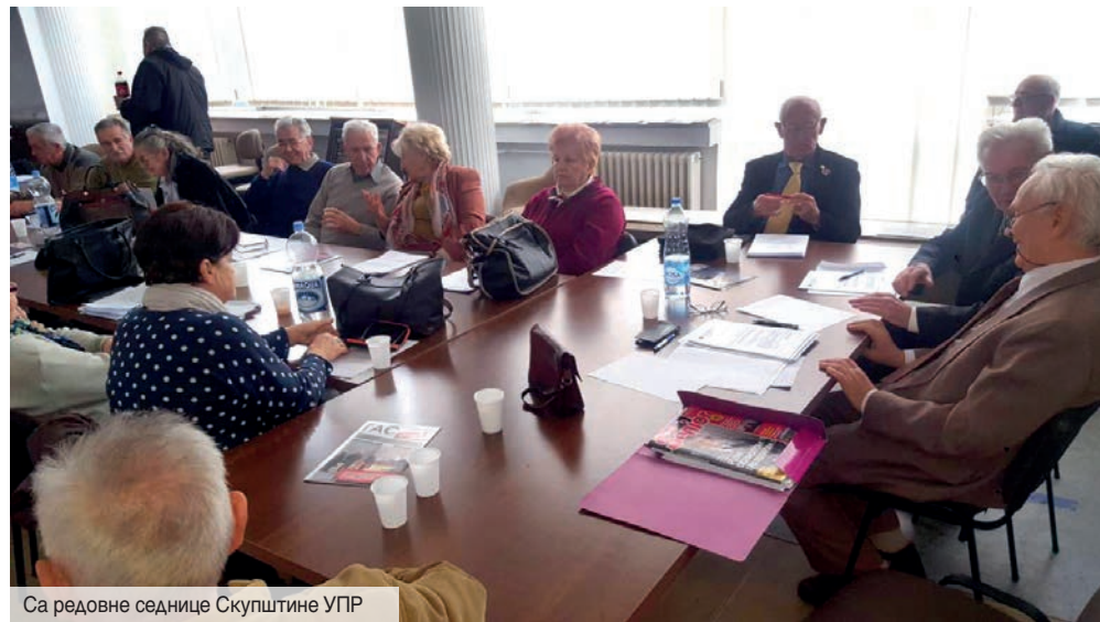
Са редовне седнице Скупштине УПР

Када читаоци буду у рукама држали овај број наших новина, вероватно ће већ бити обновљен Уговор са ДДОР-ом о осигурању чланова Удружења пензионисаних радника ЈП „Србијагас“. Или ће, бар, реализација тог посла бити у завршној фази.