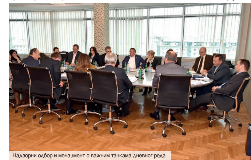
Надзорни одбор и менаџмент о важним тачкама дневног реда